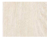
Blanc de Chine